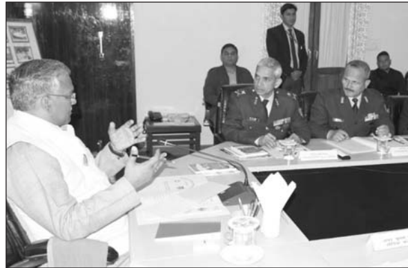
राज्य सैनिक बोर्ड की बैठक लेते सीएम त्रिवेन्द्र सिंह रावत

उत्तर उजाला ब्यूरो देहरादून। मुख्यमंत्री त्रिवेन्द्र सिंह रावत की अध्यक्षता में सोमवार को मुख्यमंत्री आवास में राज्य सैनिक बोर्ड की छठवीं बैठक सम्पन्न हुई। बैठक में सर्वप्रथम राज्य सैनिक बोर्ड की पंचम बैठक में उठाए गए बिंद. ओं की प्रगति रिपोर्ट प्रस्तुत की। जिसमें प्रदेश