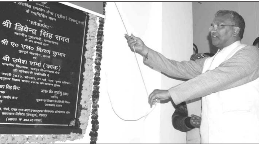
अंतरिक्ष उपयोग केन्द्र का लोकार्पण करते सीएम त्रिवेन्द्र सिंह रावत

अपने संबोधन में मुख्यमंत्री त्रिवेन्द्र सिंह रावत ने यूसैक परिवार को बधाई देते हुए कहा कि आज (यूएसएसी) को अपना भवन मिल गया है। इससे उत्तराखण्ड राज्य को बहुत लाभ होने वाला है। उन्होंने कहा कि उत्तराखण्ड अपने जल, जंगल, जमीन से जुड़े विषयों में स्पेस टेक्नोलॉजी की सहायता ले सकेगा। मुख्यमंत्री ने कहा कि स्पेस टेक्नोलॉजी राज्य के विकास एवं आपाकालीन परिस्थितियों में महत्वपूर्ण भूमिका निभा सकती है। इसके साथ ही साइंस सिटी को डीपीआर को स्वीकृति मिल गई है। शीघ्र ही इसका निर्माण शुरू होगा। उन्होंने कहा कि नवोन्मेषी लोगों के